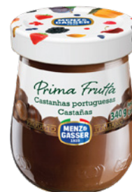
PRD00443 CREME PRIMA FRUTTA CASTANHA PORTUGUESA 12X340G