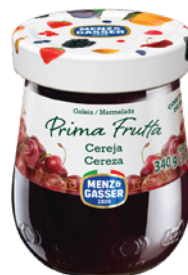
PRD00438 GELEIA PRIMA FRUTTA CEREJA 12X340G