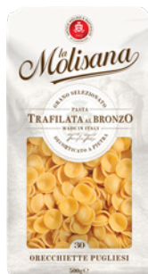
PRD00450 MASSA ORECCHIETTE LA MOLISANA 24X500G