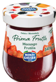
PRD00237 GELEIA PRIMA FRUTTA MORANGO 12X340G