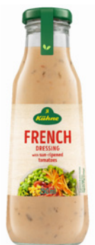
PRD00608 MOLHO SALADA FRANCÊS KUHNE 8X250ML