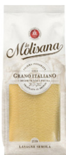
PRD00177 MASSA LASAGNE SEMOLA LA MOLISANA 12X500G