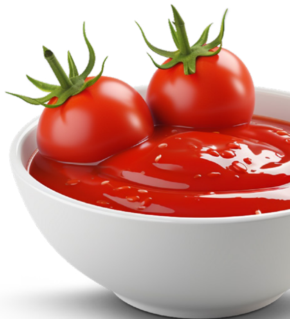
PRD00615 PASSATA DI POMODORO CLASSICA EM GARRAFA DE VIDRO MUTTI 12X700G