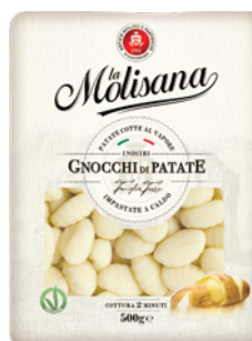
PRD00114 GNOCCHI DE BATATA LA MOLISANA 12X500G