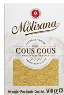
PRD00125 COUSCOUS LA MOLISANA 12X500G