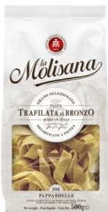
PRD00372 MASSA PAPPARDELLE LA MOLISANA 12X500G