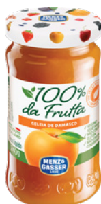
PRD00444 GELEIA 100% FRUTA DAMASCO 8X240G