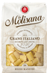
PRD00485 MASSA MEZZE MANICHE LA MOLISANA 24X500G