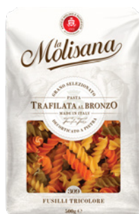
PRD00489 MASSA FUSILLI TRICOLORE 24X500G