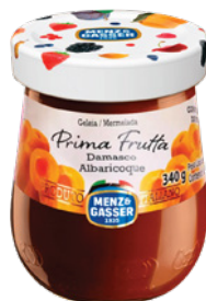
PRD00262 GELEIA PRIMA FRUTTA DAMASCO 12X340G