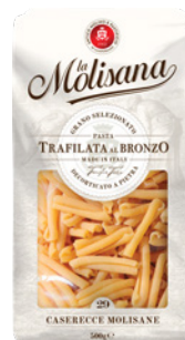
PRD00452 MASSA CASERECCE LA MOLISANA 24X500G