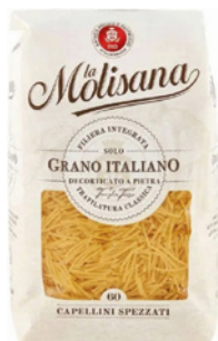
PRD00225 MASSA CAPELLINI SPEZZATI LA MOLISANA 24X500G